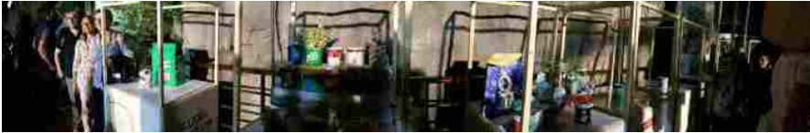
I primo tre lavori premiati da Barattolino Scuola Missione Green