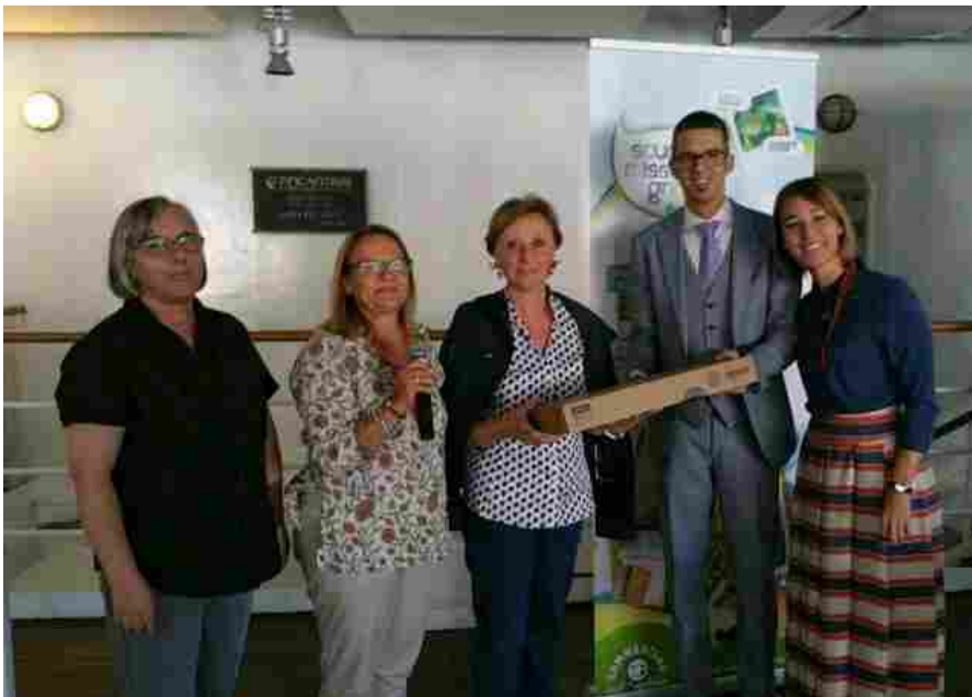
La premiazione del primo classificato: la Scuola di Corato